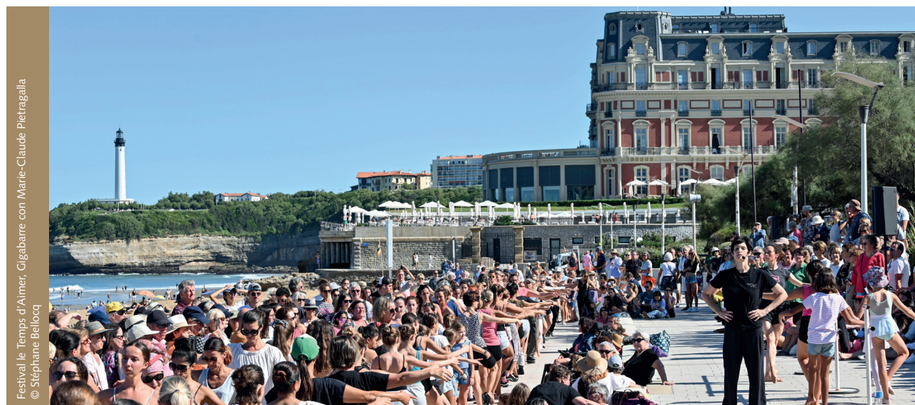
Festival Le Temps d'Aimer la Danse con Marie-Claude Pietragalla